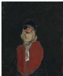
Le juge -hst- 92x65 – 1977-Coll.particulière.

Près de Sens, dans l'Yonne, avec sa femme et ses 4 enfants, ils rénovent une ferme et y inviteront de nombreux amis. Dans un bel atelier, il travaille sur une série de grands formats : Les Épousailles des nains , et aborde des thèmes tels que : les Bigotes, Les Juges, les Musiciens . Exposition avec le sculpteur Eugène Dodeigne au Musée Galliéra à Paris en 1971. Pour la SACEM réalise en 1978 une peinture murale : le Grand Orchestre . Les dessins préparatoires sont exposés à la Galerie Erval . La galerie Nova Spectra , à La Haye, l'expose en 73, 76, 80, 81.