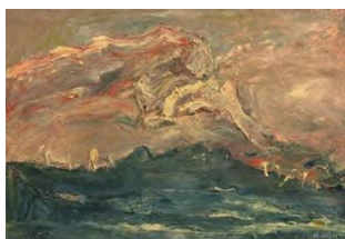
Sans titre - hst-50x73- 1992 - Coll. Atelier Gillet.

Peint des paysages maritimes qui, sous le titre Tempêtes et Bateaux Ivres , sont présentés à la Fiac en 1994 par la Galerie Ariel . Invite, en Juillet 1994, ses amis à Saint-Suliac pour fêter avec Jean Pollak leurs 70 ans et 50 ans de collaboration. Parution aux éditions de l'Amateur d'une monographie avec un texte de Philippe Curval . Expositions personnelles à la Galerie Henry Bussière (93, 94, 95, 97), la Galerie Duchoze à Rouen (96, 97, 99) et la Galerie Fred Lanzenberg de Bruxelles.