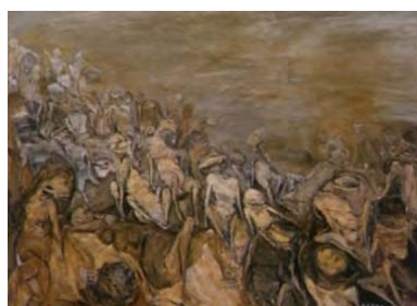
Des tas de gens -hst-180x245 -1966- Coll. M.A.M. Paris.

En 1964 quitte Paris pour la région de Saint-Malo. Il peint des personnages suggérés puis plus expressionnistes :