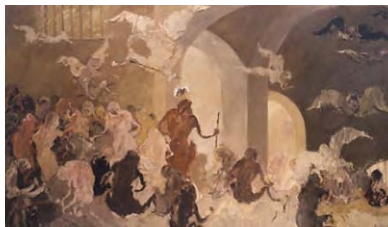
La prison des fous-hst-114x195-1997- Coll. Stéphane Janssen.

Pendant l'été 95 réalise une centaine de dessins publiés sous le titre de Journal ce qui l'incite à reprendre l'étude des personnages : Les Demoiselles d'Avignon, les Apôtres et en 98 la Danse . Rétrospective « 50 ans de peinture », Sens, 1999. Édite un livre de 21 gravures les Oubliés de l'Arche . Texte de Lydia Harambourg .