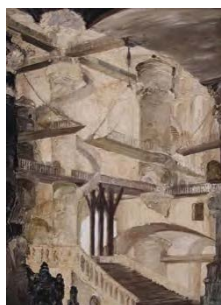
Palais ou prison-hst- 162x130-1980- Coll. Philippe Embiricos.

Revient vivre à Paris mais passe tous les étés à peindre près de Saint-Malo. Poursuit sa recherche sur les personnages et en parallèle aborde de nouveaux thèmes : Villes, Prisons et Palais, Natures mortes... Rétrospective au Centre National des Arts Plastiques à Paris en 1987 (catalogue préfacé par Anne Tronche et Gérald Gassiot-Talabot ).